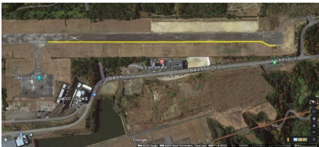
最大2ワイド（2台並走）の区間

WEMは車両が小さいので規制はかけません。しかしソーラーカーについては制限をかけます。コース幅が広く直線なので問題にはなりません、下記図の黄色区間は制限区間とします。黄色区間は最大2ワイド（2台並走可）まで、その他の区間は当初の通り3ワイド（3台並走）まで可能とします。